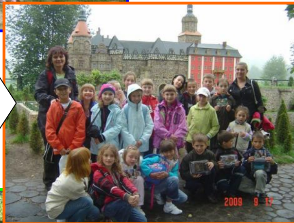
W Parku Miniatur Zabytków Dolnego Śląska