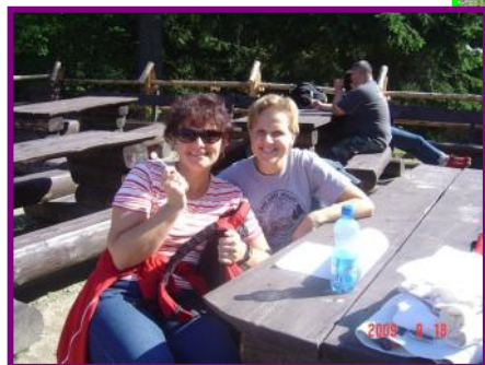
Nasze panie tak się wesoło bawiły