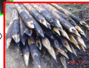
Kto zgadnie co to jest?