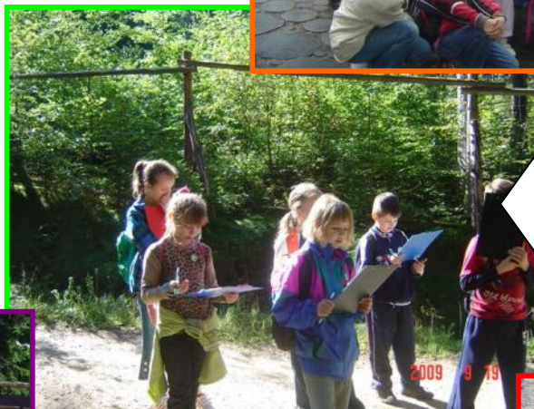
Zajęcia w Karkonoskim Parku Narodowym