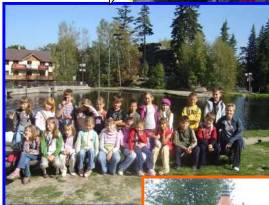
Dokarmiamy kaczki pływające po miejskim stawie