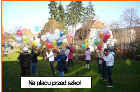
Na placu przed szkołą

Z tej okazji odbył się apel po wi cenie prawom dziecka, oraz 20 rocznicy uchwalenia Konwencji o Prawach Dziecka. Kulminacją obchodów zwi zanych z Dniem Praw Dziecka był happening „Balony do nieba”.