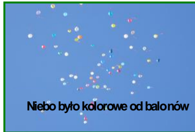
Niebo było kolorowe od balonów

Z tej okazji wydano jubileuszowy informator, który przybliżył historię praw dziecka. Znalazły się w nim również informacje na temat konkursów organizowanych na terenie naszej placówki a zwi zanych z tą tematyką. Oprócz tego w różnych miejscach szkoły zostały zawieszane gazetki cenne