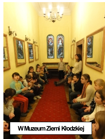
W Muzeum Ziemi Kłodzkiej