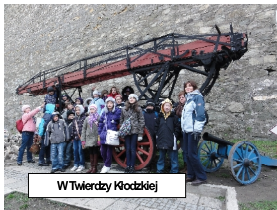
W Twierdzy Kłodzkiej

Tam zwiedziliśmy neorenesansowy zabytkowy ratusz, który został zbudowany w latach 1887 - 1890. Od 1990 roku jest siedzibą burmistrza Kłodzka. Na parterze mieści się Biblioteka Publiczna, 3 kawiarnie i informacja turystyczna. W ratuszu mieści się również Kłodzki Oddział Polskiego Radia Wrocław.